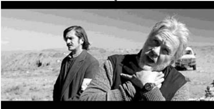
Visual / दृश्य 3