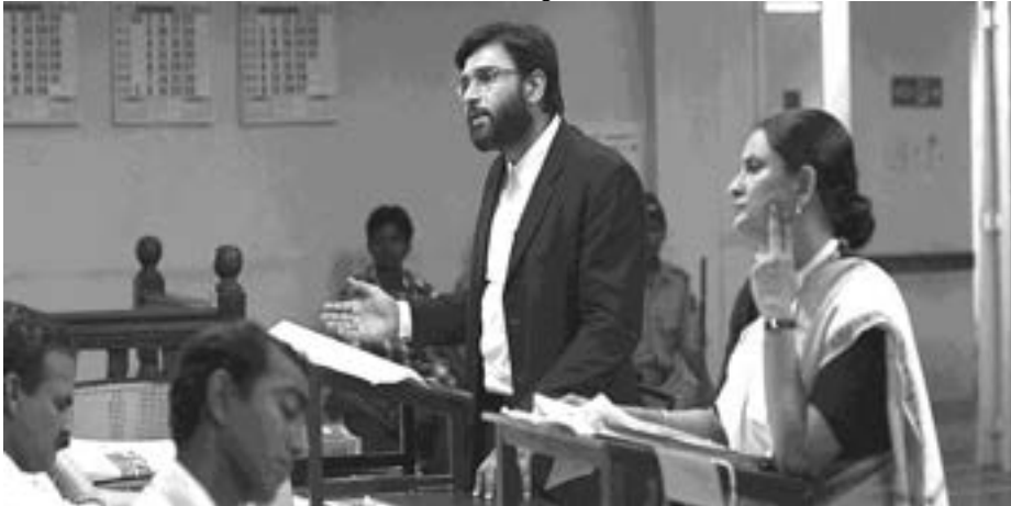
Visual / दृश्य 2