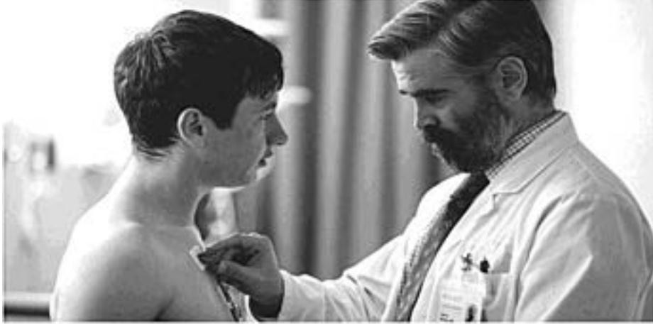
Visual / दृश्य 1